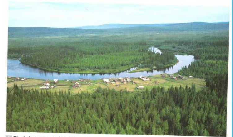
2 The taiga, an area full of forests